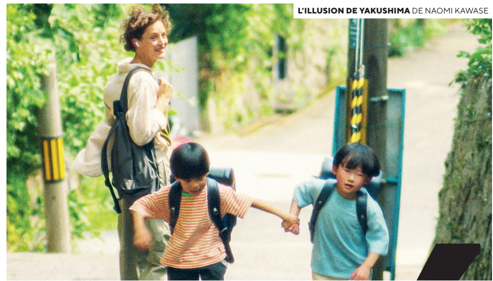
L'ILLUSION DE YAKUSHIMA DE NAOMI KAWASE