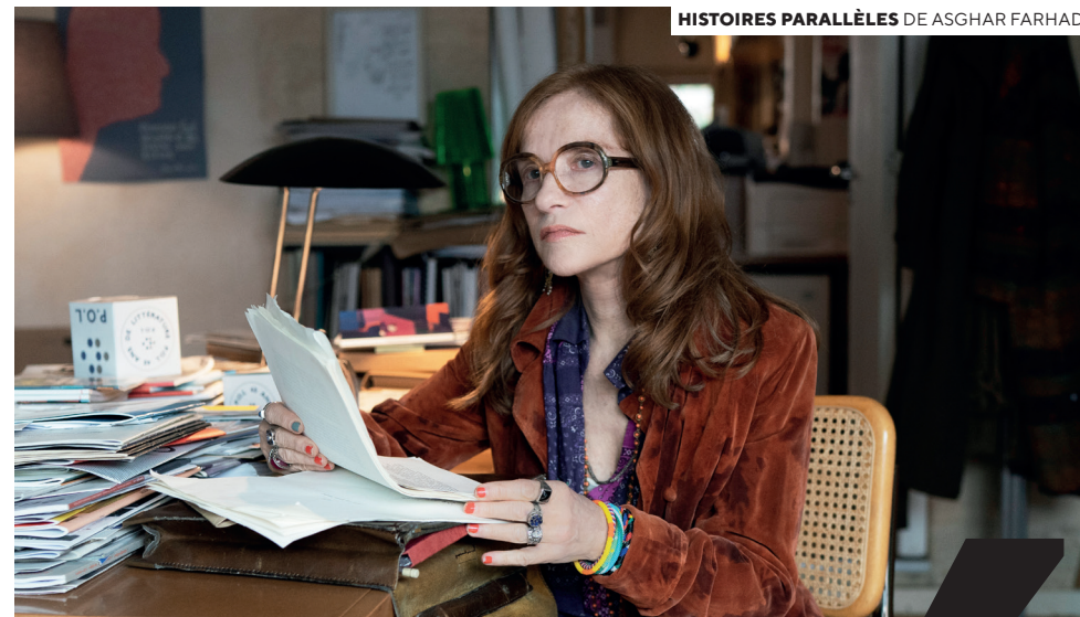
HISTOIRES PARALLÈLES DE ASGHAR FARHADI